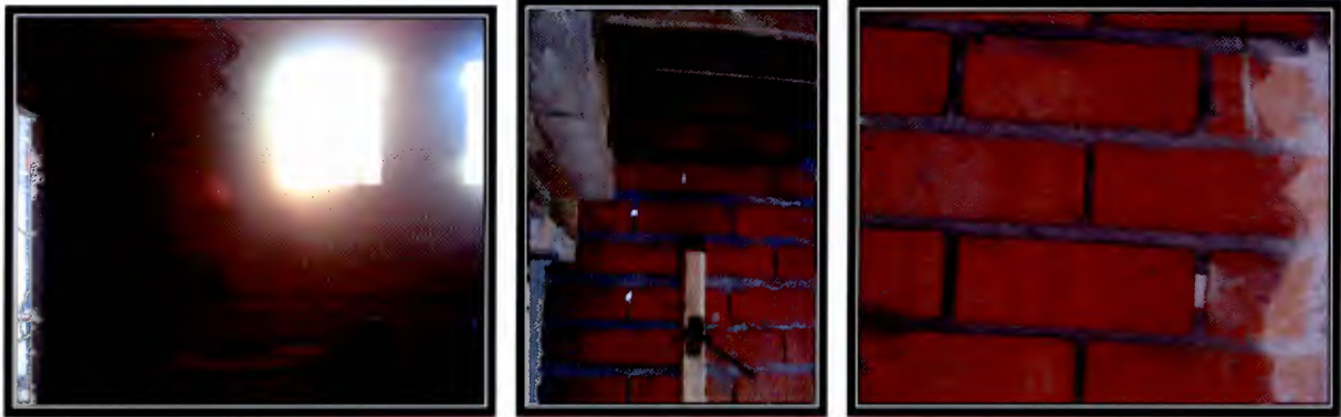
Foto 7, Foto 8 y Foto 9: Falta mortero de unión vertical entre ladrillos

Obra: Estadio Fiscal Luis Valenzuela Herмосilla