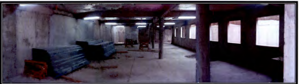
Foto 17: Recintos que forman parte del proyecto son utilizados como bodegas de almacenaje de materiales