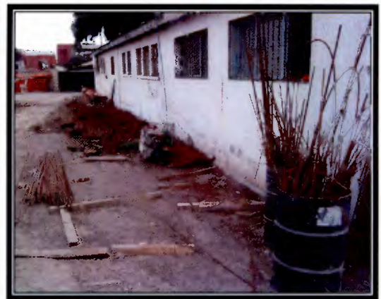
Foto 15 y Foto 16: Materiales acopiados en zonas abiertas y sin resguardo